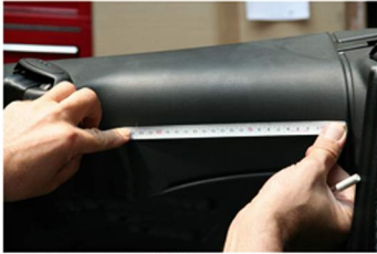
22,4 cm (Fahrer- und Beifahrerseite messen und markieren, wo gebohrt werden muss!)