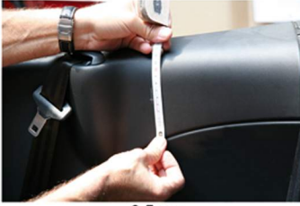
8,5 cm (Fahrer- und Beifahrerseite messen und markieren, wo gebohrt werden muss!)