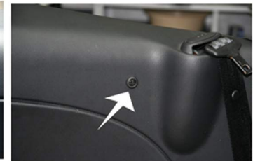
mitgelieferte Kappe einsetzen