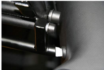
Halterung rechts und links