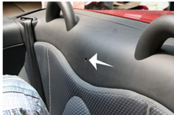
Dieses Loch ist, genau in der Mitte der hinteren Sitzbank! Der hintere Teil des Windschotts muss gerade gehalten werden vor dem Bohren!